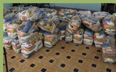
Distribuição de cestas básicas encaminhadas pela Firjan em parceria com a Subsea 7